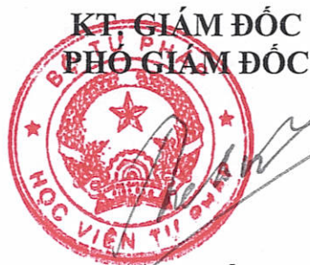
Trương Thế Côn